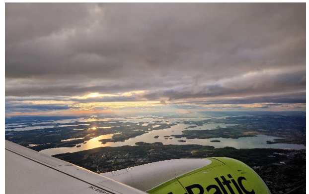
Abbildung 1 Anflug.

Denn auch Schweden als skandinavischer Wohlfahrtsstaat bietet aufgrund seiner sozialpolitischen Entwicklung und gegenwärtigen Ausrichtung Möglichkeiten für einen reellen Vergleich bildungspolitischer Systeme. So z. B. eine 100-jährige sozialdemokratische Bildungspolitik, aus der eine 10-jährige Gemeinschaftsschule hervorgegangen ist. Es herrscht eine relative pädagogische Autonomie von Schulen und Unterricht vor, eine im europäischen Vergleich gleichbleibend hohe Quote von AbiturientInnen von etwa 50% 1,2 sowie freie Schulwahl. Zu den weiteren selbstverständlichen Markern schwedischer Bildungspolitik zählen sowohl die Individualisierung als System als auch Inklusion.