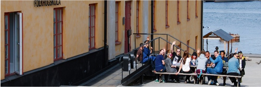
Abbildung 10

Wir erfahren, dass diese Auszeit sogar arbeitsgesetzlich gesichert und bezahlt werde. Auch hier auf Skeppsholmen kommen um halb elf alle Schüler und Mitarbeiter zum Fika in die Cafeteria der Schule. Das anfängliche Gemurmel erst über Kaffeetassen hinweg wird zunehmend lauter und mündet in eine fröhliche, ausgelassene Kakophonie vieler menschlicher Sprecher. Fika führt die Menschen zusammen und verhilft auch zu einem entspannteren Miteinander und damit zu einem effektiveren Arbeiten.