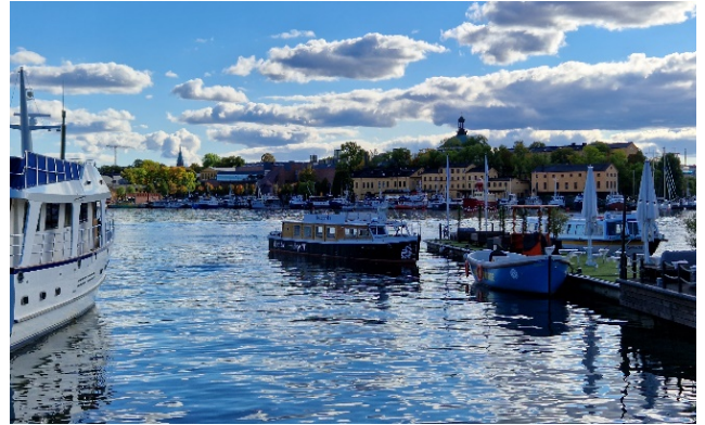
Abbildung 3 Blick auf Skeppsholmen