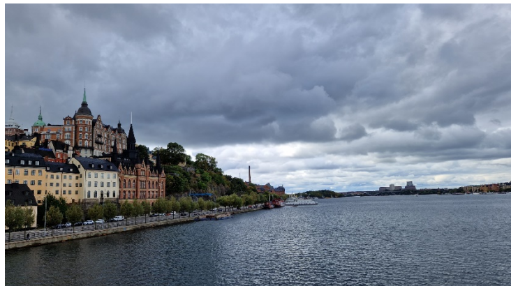
Abbildung 11 Blick auf Södermalm

Wir waren zu Gast in der LBS Stockholm Södra , einem privaten kreativen Gymnasium. Die Vorabrecherche zur Schule führte mich auf deren Website. Diese zeigt sich professionell gestaltet und ähnelt eher einem bunten Imagefilm. Die LBS logiert in einem modernen Bürogebäude – zusammen mit anderen privaten Schulen. Dies sei der größte Bildungscampus in Schweden, stellt Rektor Petter zu Beginn des Besuchs klar. Das Interieur der Schule ist modern, die Ausstattung scheint exzellent. Kein Wunder, die Schule ist erst 2014 installiert. Zurzeit arbeiten dort 35 Lehrer mit 500 Schülern daran, die Hochschulreife in drei Jahren zu erreichen.