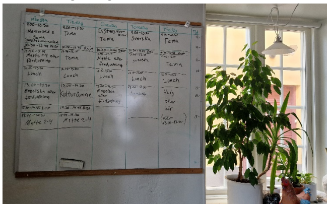
Abbildung 9 Impression 2 aus der Folkhögskole

Die Organisation des Bildungsangebotes ist als Wochenplan auf einem prominent aufgehängten Whiteboard handschriftlich festgehalten. Je nach Absprache in den