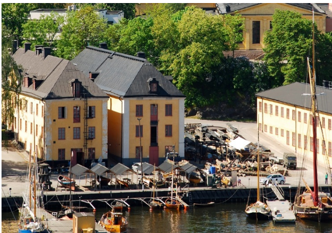
Abbildung 4

Also reiste ich in Schwedens Hauptstadt und war gespannt, wie sich mir die Schulen in Stockholm präsentieren werden.