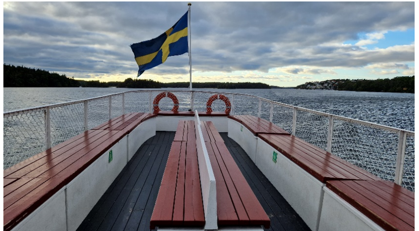
Abbildung 14 Auf dem Mälaren

Und während das eher konservative Lager Schwedens die Entwicklung also verteidigt, wird dieser Umstrukturierungsprozess von den Sozialdemokraten kritisch beäugt. Sie kritisieren die zunehmende Segregation der Schüler durch ein allgemein-bildendes Schulsystem, das unterschiedlich finanziell ausgestattet und ideell ausgerichtet ist.